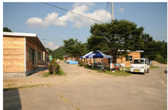
図3 地元工務店建設の木造仮設住宅（三春町）