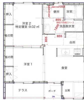
図4 短期利用型災害公営住宅のモデル住戸