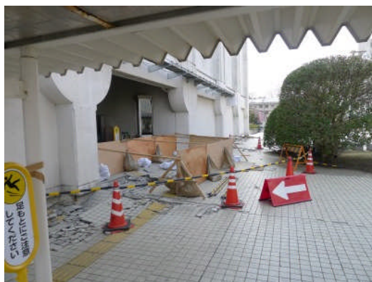
写真1 市役所周辺の地盤変状

大洗町に近い大野地区では、高速道路の橋脚で地盤との段差が見られ、液状化の痕（写真8）が見られた。水戸市および周辺地域では、住宅の塀に大谷石と見られる石が使われているケースが多かった。