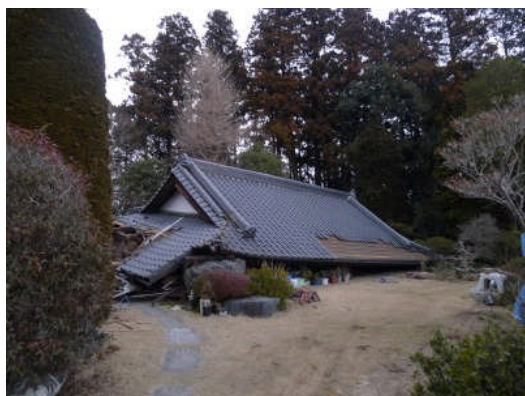
写真 21 1F が完全に崩壊した住宅

大谷石と見られる石を使った塀の被害が多い。農家型の住家が倒壊するなどの被害(写真21, 22)が見られた。道路に埋設されたマンホールが大きく浮き上がっていた(写真23)。水田を埋め立てた敷地に建つ住宅で、モルタル外装仕上げが落下する被害(写真24)が見られた。