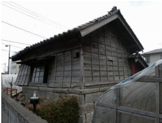
写真7 納屋の被害（水戸市青柳町）