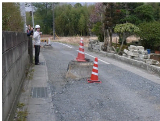
写真 23 道路の地盤変状(写真 22 の前面道路)