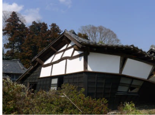
写真 10 全壊状態の納屋 (那珂市門部)