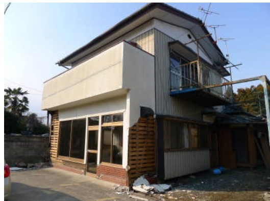
写真 14 モルタルの剥落 (那珂市瓜連)