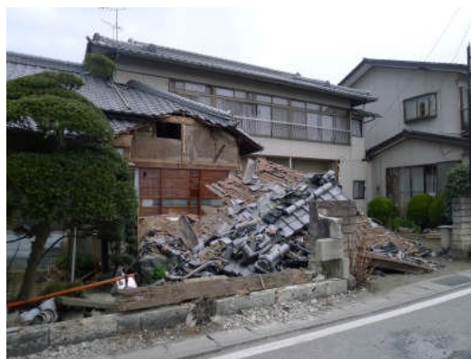
写真 22 住宅の玄関部分の崩壊