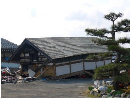
写真 9 納屋の倒壊 (那珂市門部)

住家が大きな被害を受けていた。その他、門部坏地区でも、納屋の倒壊が多く見られた。