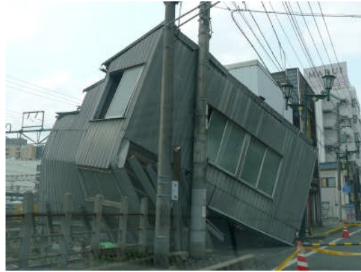
写真4 S造の倒壊（水戸市三の丸）