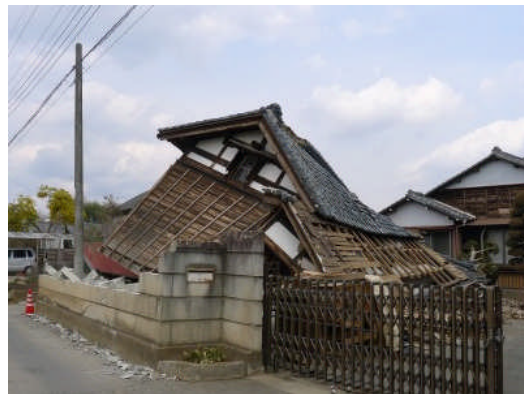
写真6 納屋の被害（水戸市青柳町）