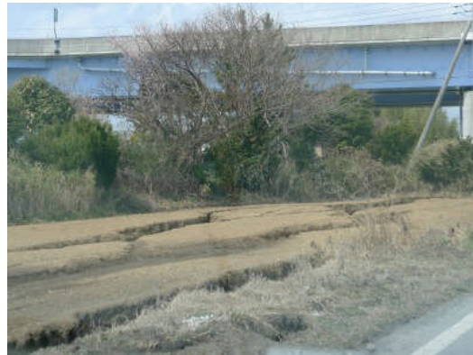
写真8 道路沿いの地盤変状(水戸市大野地区)