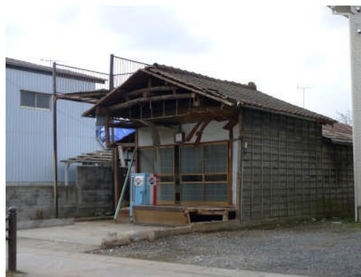
写真2 損壊部分が撤去された住宅(水戸市本町)