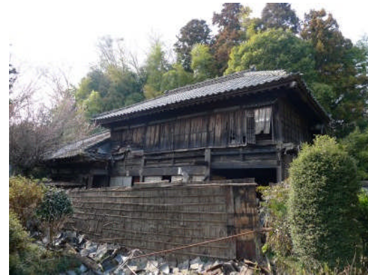
写真 12 下屋の被害 (那珂市門部)