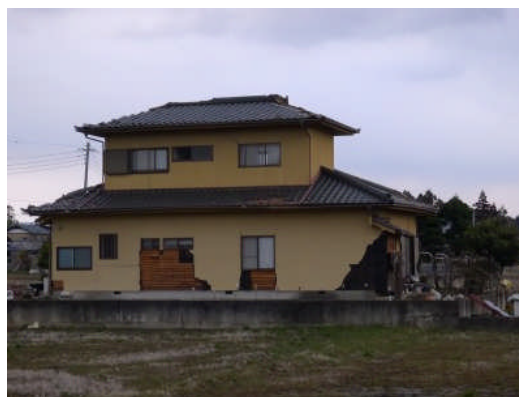
写真 24 モルタル外壁の剥落