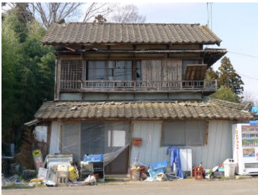
写真 11 商店の被害 (那珂市門部)