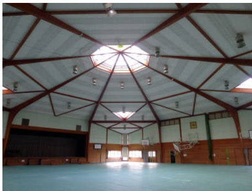
写真 16 体育館内部