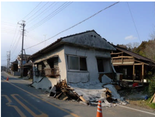
写真 13 倒壊した住宅 (那珂市瓜連)

瓜連の市街地で、2階建てモルタル外装の住家(1階商店?)が、道路側に完全に倒壊していた(写真13)。ただし、空家であったと想像される。周辺の商店で一部モルタル外装仕上げが落下しており、内部の木材に劣化が見られた。(写真14)