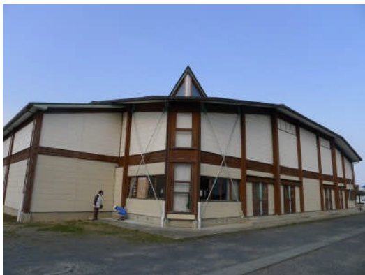
写真 15 集成材構造の木造体育館

木造校舎（写真 18）では、木材による筋かいのはずれ（写真 19）、RC 造の階段室との衝突による金属製屋根板・木質床材・内装材の変形が見られた。木製ベランダの手摺り支柱の破損・はずれが見られた。隣接する那珂市役所支所に設置された震度計の設置状況（写真 20）を確認した。