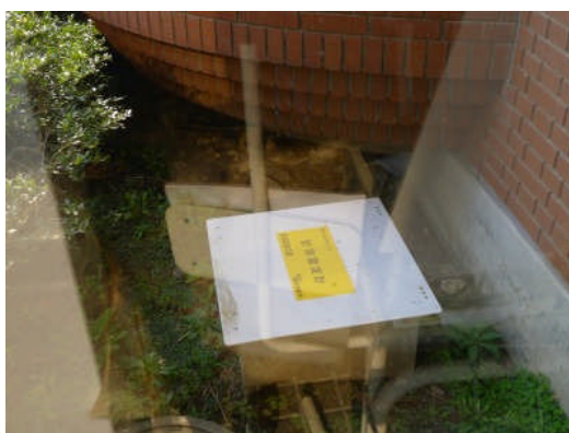
写真 20 震度計設置状況（瓜連支所）