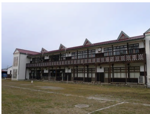
写真 18 木造校舎