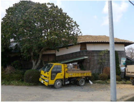
写真3 倒壊した長屋門（水戸市吉沼町）