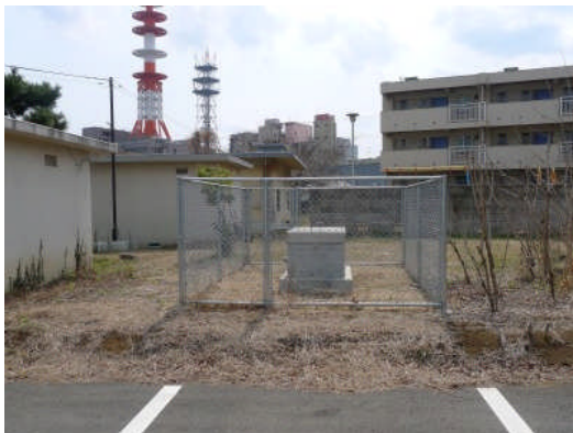
写真5 JMA地震計(水戸市金町)設置状況