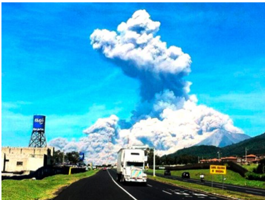
写真2. 2つ目の地震発生から8日後に噴火したグアテマラ・フェゴ火山