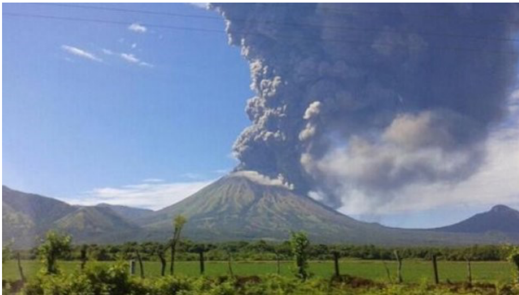
写真1. 2つ目の地震発生から3日後に噴火したニカラグア・サンクリストバル火山