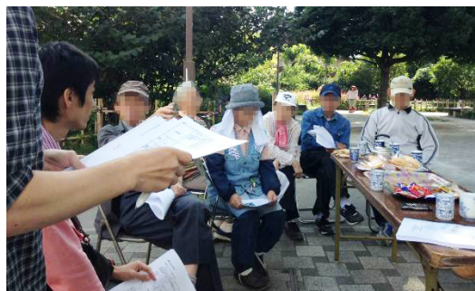
写真 1 グループインタビュー調査の様子

上記を踏まえ、自治体、地域団体等による高齢者等の地域活動参加促進手法を開発する。