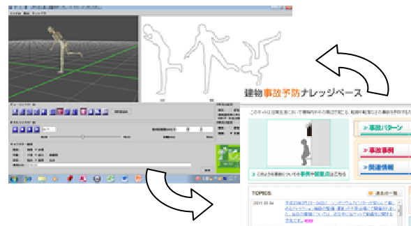
入浴行為等動作データとその他の DB との連携