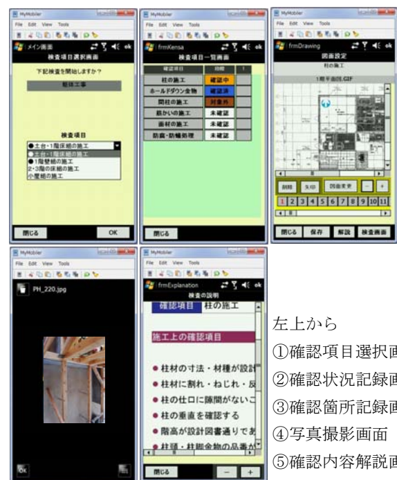
左上から ①確認項目選択画面 ②確認状況記録画面 ③確認箇所記録画面 ④写真撮影画面 ⑤確認内容解説画面