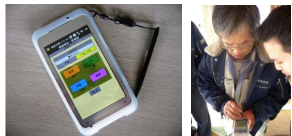
図 3 使用したスマートフォンと検証実験の様子 (左) 検証実験に使用したスマートフォン (右) 検証実験の様子。20 歳代から 50 歳代までの 4 名の大工が検証を行った。

(注) 各製造段階において「環境伝票」を発行することにより、施工現場に搬入される木材製品の正味の炭素固定量を表示する。